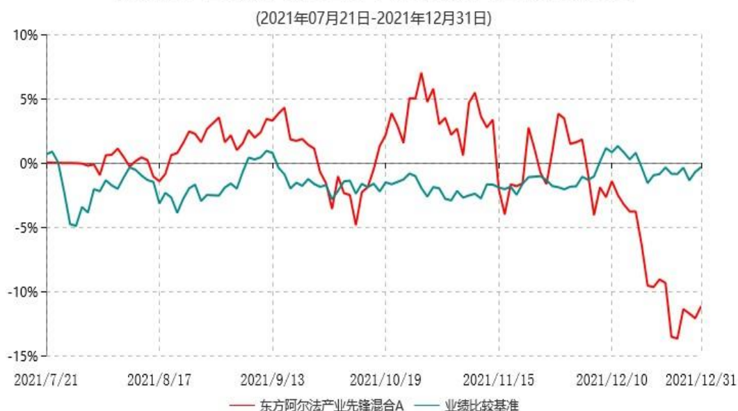
东方阿尔法产业先锋混合A累计净值增长率与业绩比较基准收益率历史走势对比图