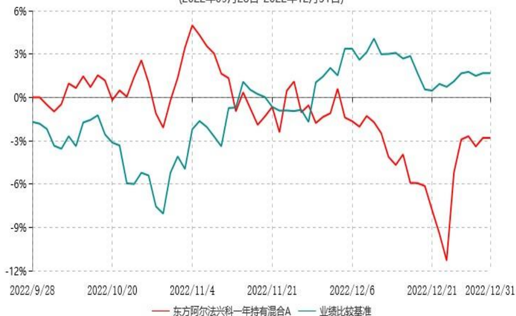
东方阿尔法兴科一年持有混合C累计净值增长率与业绩比较基准收益率历史走势对比图