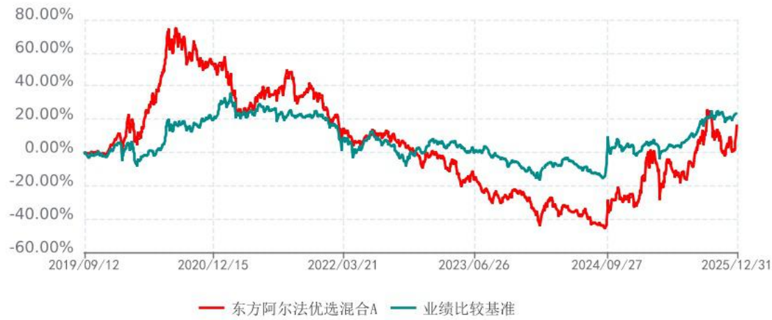
东方阿尔法优选混合C累计净值增长率与业绩比较基准收益率历史走势对比图